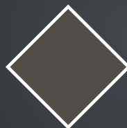
Umbra VEKA SPECTRAL Ultramatt